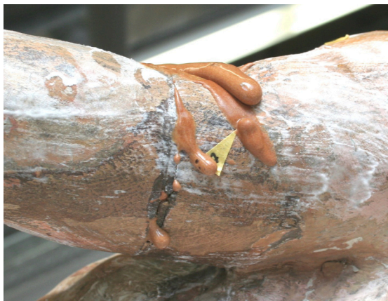
Injektion von einer Kittmischung aus Phenolharzkügelchen und Hautleim. Diese wird durch eine 60 mm lange und 0,6 mm starke Kanüle in eine stark gelockerte Dübelverbindung einer Holzskulptur injiziert.